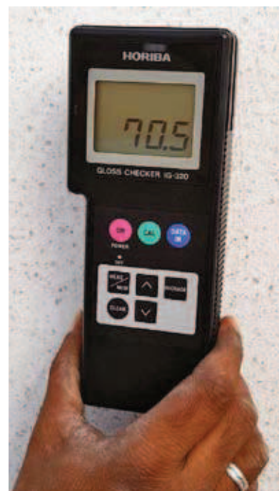
Jakość wyrobów kontroluje się polyskromierzami elektronicznymi.

Firma może poszczycić się dużą renomą na rynku, a wysokiej jakości produkty z konglomeratu kwarcowego stanowią uzupełnienie palety propozycji. Co istotne, główne rynki zbytu dla Tab India po-